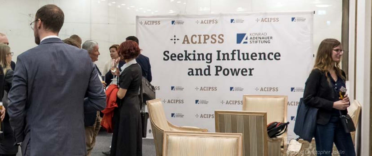
Relaxed mood among all participants during the final reception.

towards Russia or China as a real opportunity – often in contrast to a predominantly EU-friendly population. It is therefore all the more important for any future EU strategy to have special knowledge of the internal demographic-political perspective of these states and to take this into account in its approach. However, this requires a strategic vision and cohesion among the member states in order to create the necessary political will, which must then manifest itself both in a clear, open communication strategy without empty promises and in concretely structured implementation and goal-oriented action rather than in evermore new papers and plans.