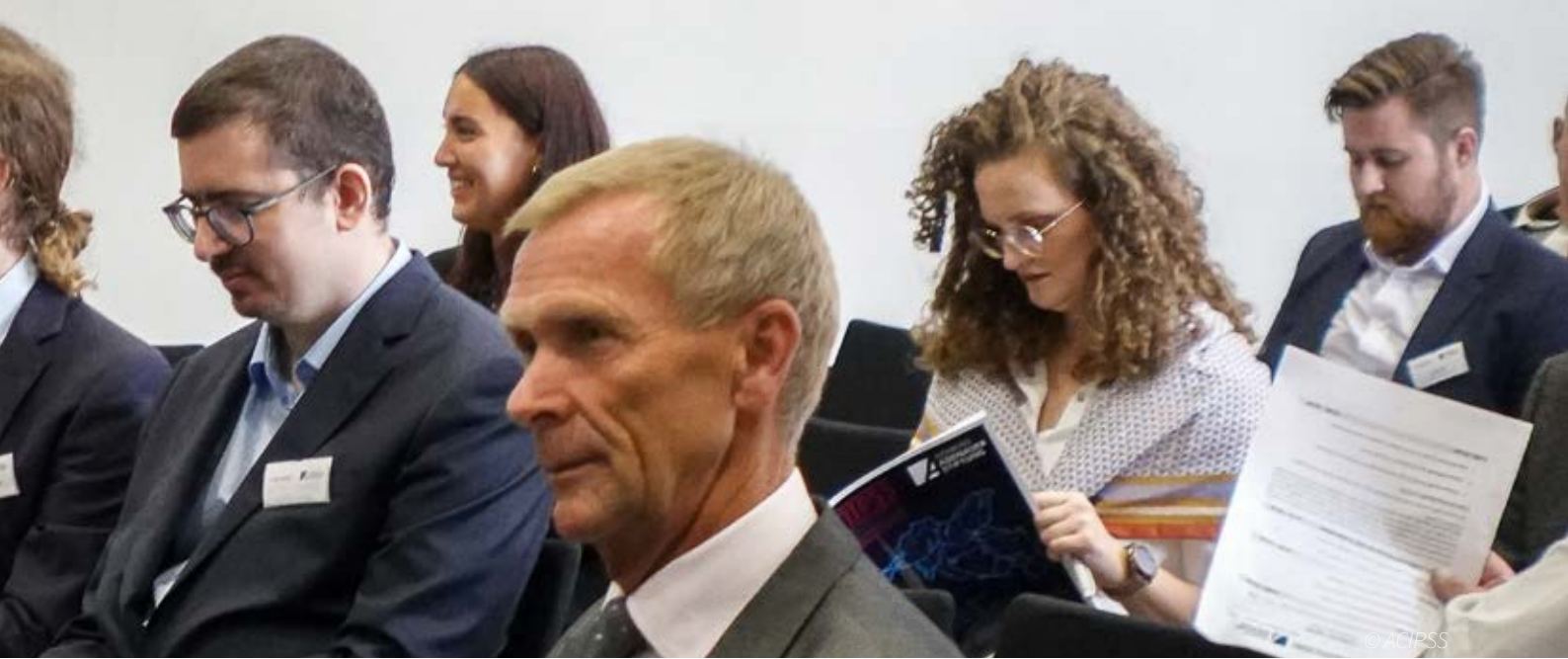
A look at the invited audience.

between the USA, Europe and China), there are dynamics that exert a decisive influence on the region. Together with the recent European crises (Brexit, migration), these fault lines need to be addressed and analysed. All this has a comprehensive impact on the regional area under discussion and puts Germany, Austria and also the European Union under increasing pressure to act. The aim is to contribute to the research and public discourse, to point out options for action and, last but not least, to put the region back in the spotlight.