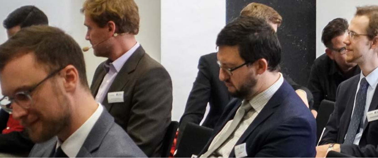
Ein Blick auf das geladene Publikum.

geopolitischen Einflussversuchen externer Akteure in der Region und globalen Krisen (wie das Wiederaufleben des Ost-West-Konflikts und eskalierende Handelskriege zwischen den USA, Europa und China) bestehen hier Dynamiken, die einen maßgeblichen Einfluss auf die Region ausüben. Gemeinsam mit den jüngsten europäischen Krisen (Brexit, Migration) gilt es, diese Bruchlinien zu thematisieren und zu analysieren. All dies wirkt sich umfassend auf den behandelten regionalen Raum aus und setzt Deutschland, Österreich und auch die Europäische Union unter einen wachsenden Handlungsdruck. Das Ziel ist es, zum Forschungs- und öffentlichen Diskurs beizutragen, Handlungsoptionen aufzuzeigen und nicht zuletzt die Region wieder ins Rampenlicht zu rücken.